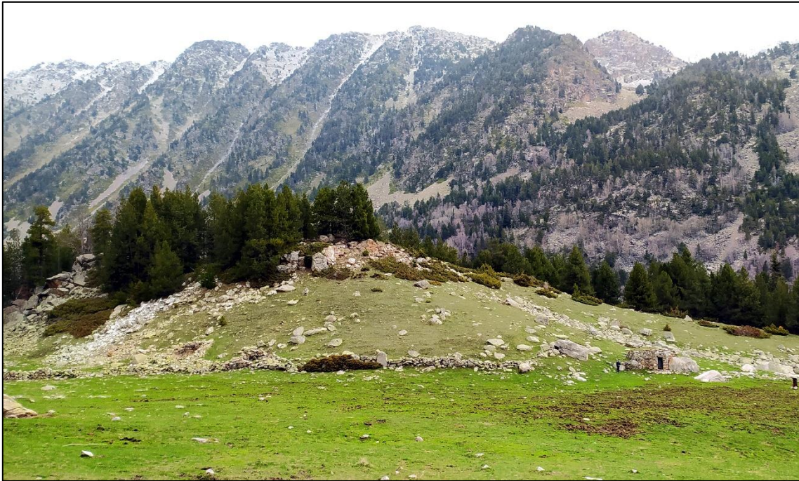
La pleta de l'Estall Serrer, amb a la dreta de cabana nova i a l'esquerra les antigues.

de pedra seca que es recolza contra una roca. Girem cap a la dreta seguint el camí i arribem a l' Estall Serrer .