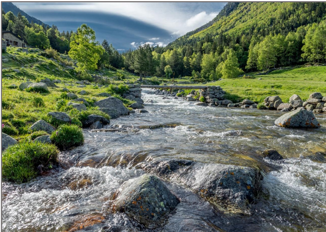
Fontverd. Primavera (Ramón Villanueva Carrasco)

A partir del moment en que deixen la clariana de Fontverd, entrem a un tram de bosc on predominen els avets amb algun pi roig, però poc abans d'arribar al Collet de l'infern el bosc és ja de pi negre ( pinus uncinata ), de nou amb algun beç prop del riu a d'alguna font i així continuarà fins el pla de l'Inglà. A la zona podem trobar les traces deixades pels animals més destacats de la fauna local, l'isard i el porc senglar, El pi negre és l'espècie dominant a l'estatge subalpí, entre els 1.700 i els 2.000 metres; la seva fusta ha estat molt utilitzada, també per la construcció de les antigues cases pairals, bigues, tiselles, solers, puntals, etc, i per a l'obtenció de carbó.