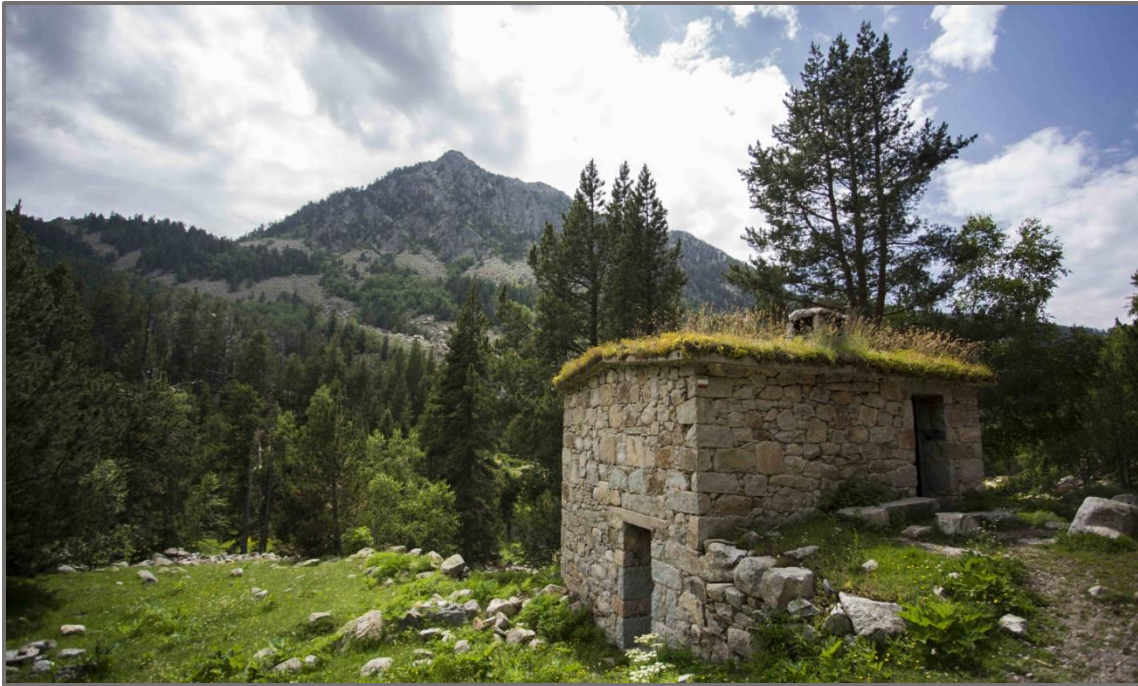
cabana de la Farga