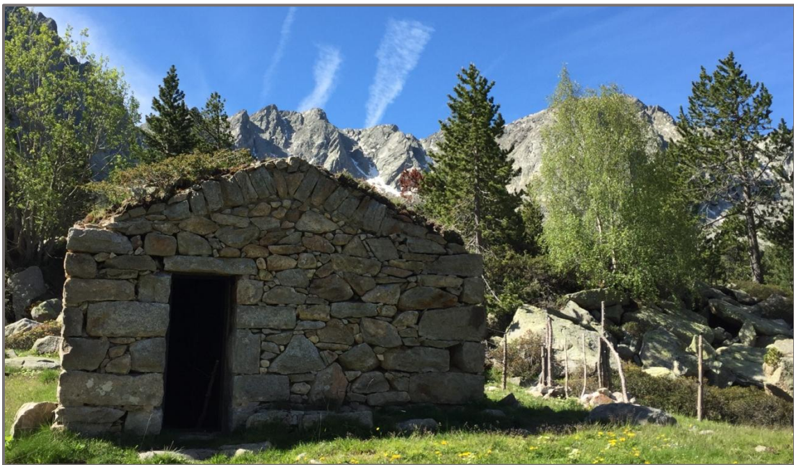
Cabana de la Barracota

El retorn es fa pel camí per on hem vingut, és a dir pel camí de la Muntanya en direcció a ponent. Passat Fontverd, hem de parar atenció a la cruïlla que hi ha arran de la carbonera que hem creuat a l'anada, on hem d'agafar el camí de la dreta, l'altre, a l'esquerra és el camí de la muntanya, que ens portaria a Ràmio.