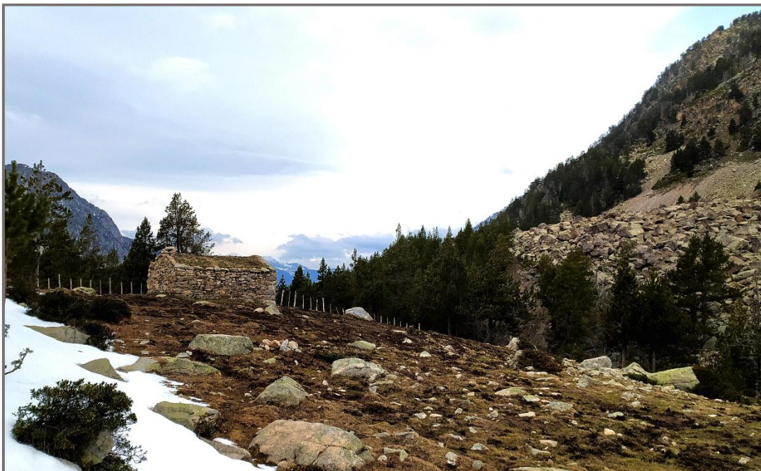
La cabana del Serrat de la Barracota.

Una altra portella dona al pla de l'Inгла, una explanada estreta que ocupa el fons de la vall. A la dreta, sobre un petit serrat hi tenim la cabana del Serrat de la Barracota, un altre exemplar de cabana de vaquer, de característiques semblants a la que hem vist a Fontverd fins el punt que semblen sortides de la mateixa mà.