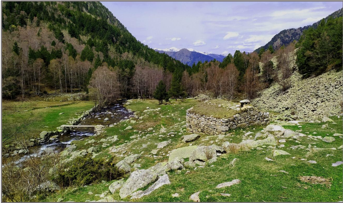
Fontverd i la cabana del vaquer.

Fontverd va ser un dels carrers cortons a ser creats i utilitzats a la vall del Madriu, a finals del segle XIX i principis del XX; un cortó és un terreny comunal que el comú llogava als particulars per portar-hi a pasturar els ramats d'ovelles durant els mesos d'estiu. És un espai on hi tenim estructures representatives del conjunt d'activitats tradicionals practicades per l'home a la vall.