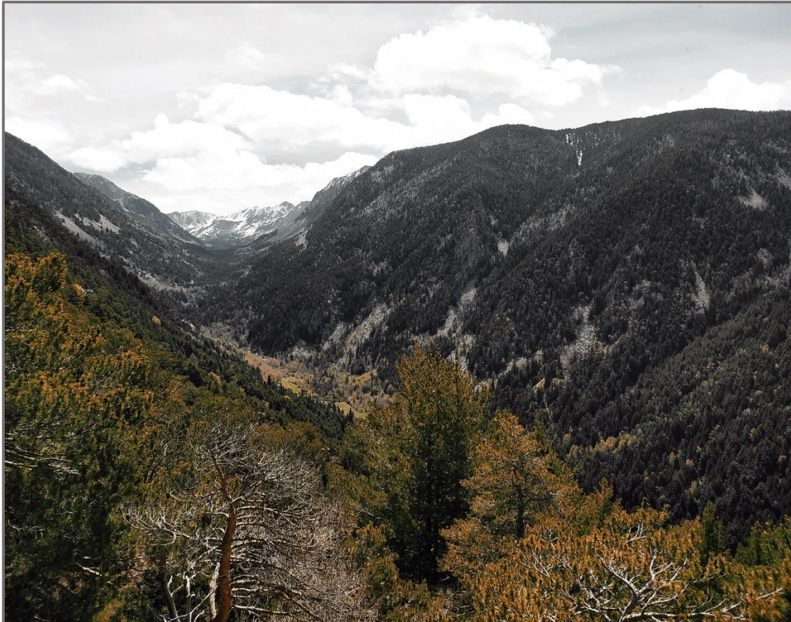
Vista de la vall del Madriu des de Coll Jovell.

De la cruïlla que hi ha a la collada surten tres camins, hem d'agafar el del mig, que ens portarà cap a Fontverd pel camí del Solà de Ràmio, el qual travessa el vessant solà per anar-se endinsant cap a l'interior de la vall. A la nostra dreta, al fons de la vall podrem veure les bordes de Ràmio, i poc més endavant la presa de captació de la qual surt el canal que va Engolasters, arran del qual hem passat abans. Per sota de la Roca de l'Estall hi tenim una borda acompanyada del corresponent prat de dall delimitat per un a paret de tanca de pedra seca, necessària per evitar que hi entressin els ramats que s'encaminaven cap a les pastures de l'interior de la vall.