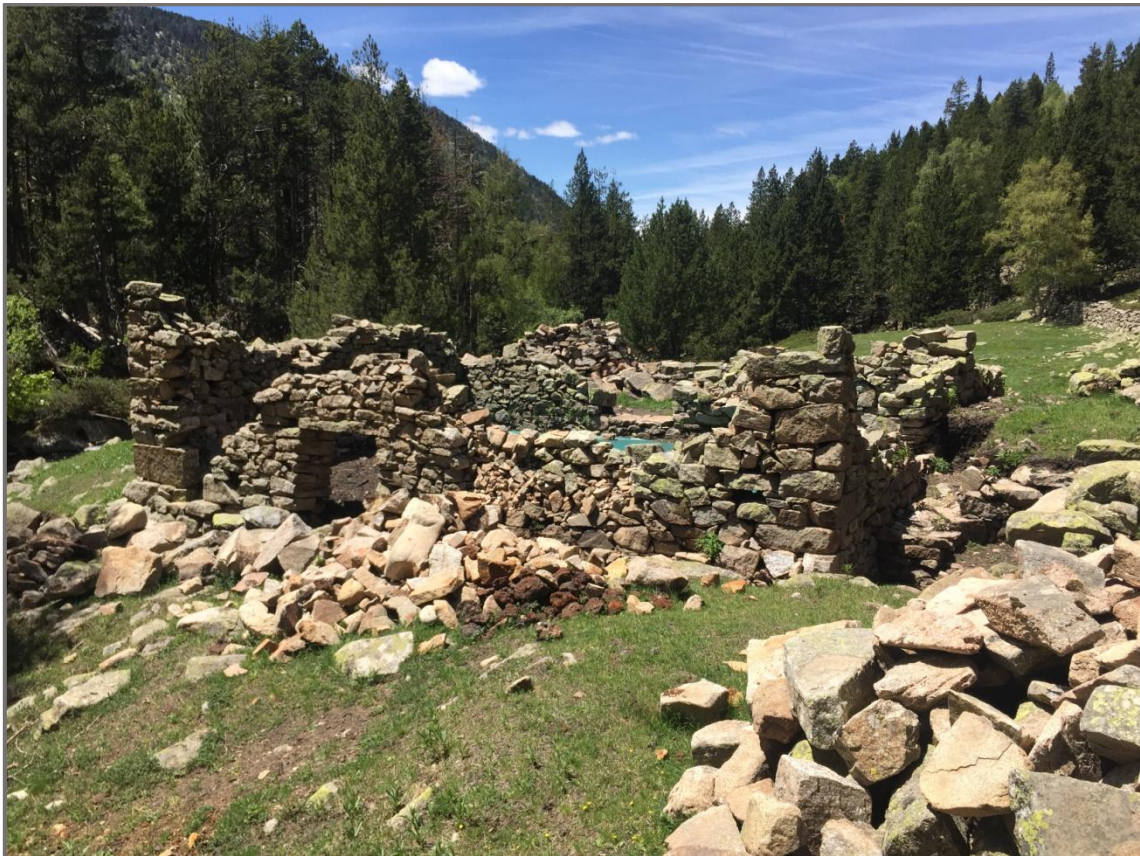
La Farga del Madriu

Al cap de poc trobem la cabana de la Farga, aquesta és la darrera cabana de pastor que es va construir a la vall, data dels anys seixanta del segle passat. Consta de dos plantes, la de sota s'emprava com cort o llenyer i la de dalt era on vivia el pastor. És tracta d'una edificació ja amb material modern i sostre de ciment, quasi pla. Constitueix un exemple l'última fase en l'evolució de les cabanes de pastor.