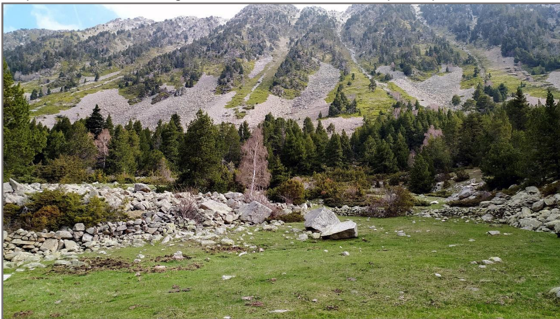
El cortó de Baell amb la seva pleta.

De nou la vall s'eixampla, a l'esquerra, per sobre del camí hi ha el cortó de Baell, un terreny de pastura, antic cortó, amb dos o tres pletes, la primera de les quals està acompanyada d'un parell de cabanes de pastor de les que queden les parets mentre que la coberta ha desaparegut, ja que era vegetal. La majoria de les cabanes de pastor tenien les parets fetes de pedra seca mentre que la coberta era feta amb branques que es recolzaven en una biga central i després es recobrien de gleba, matolls de terra i herba per impermeabilitzar-la.