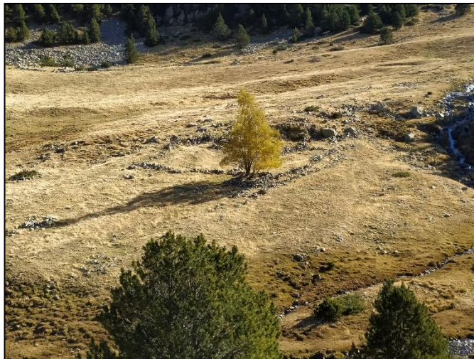
L'orri de baix del Planell Gran, vist des de l'altre riba del riu.

El primer conjunt està situat més a prop del la riba del riu i té un arbre al centre. Al peu de l'arbre hi ha la cabana, de la dreta d'aquesta parteix l'orri, que té forma d'S, i per sobre hi ha una pleta dividida en tres tancats.