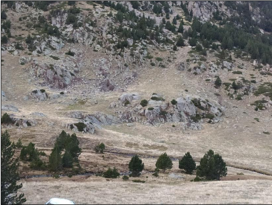
La cabana i la pleta de Claror des de l'altre costat de riu.

Per continuar l'itinerari, de la riba dreta del riu estant, cal pujar el talús que es queda a esquerra del camí, per entrar a un planell amb un lleuger pendent, entre el vessant i el riu. Hi veurem, a dreta, les restes d'una cabana de pedra recolzada en un bloc de roca natural, i a més a més s'hi distingeixen les restes d'un parell d'orris.