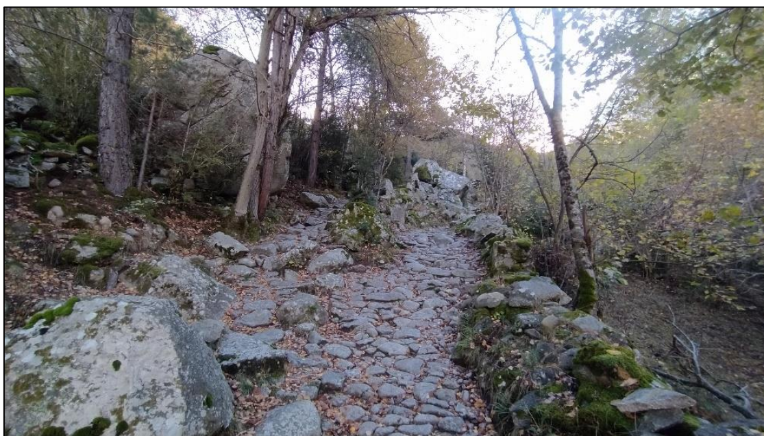
El camí de la Muntanya amb el tirader al costat.

El camí continua pujant, ara amb un pendent una mica més pronunciat, i fa ziga-zagues per facilitar la pujada. Podreu veure que el camí es descompon en dos traçats, un va fent corbes, mentre que l'altre va recte.