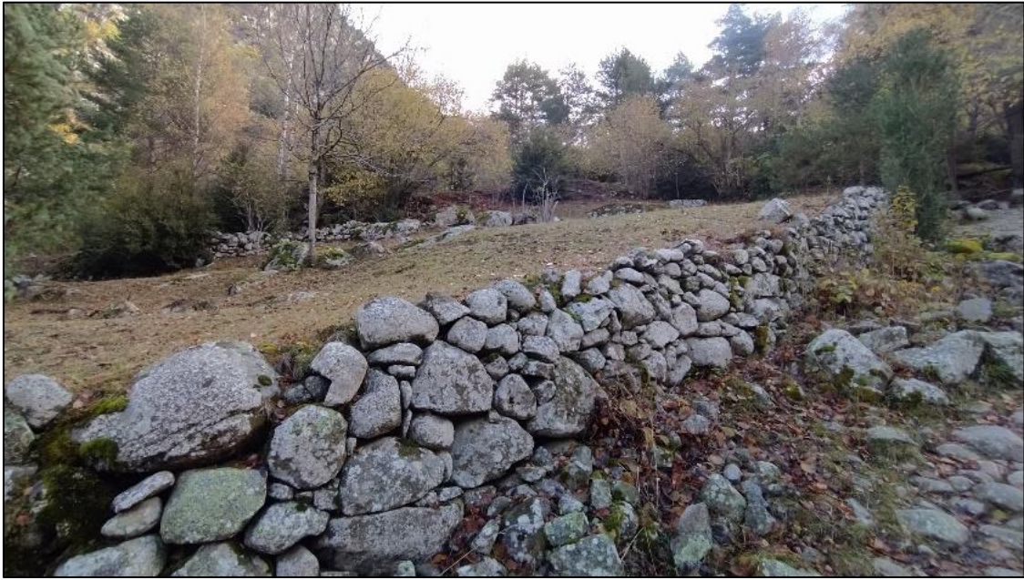
Feixes i prats a l'esquerra del camí.

Les feixes , que al país també reben la denominació de marges , són terrasses destinades a adaptar el terreny per l'obtenció de superfícies planes que poguessin ser conreades. Per a obtenir-les en un terreny en pendent s'aixecava un mur de contenció en pedra seca, que per la part de darrera s'omplia de pedra sense treballar, excepte els 50 o 70 centímetres de la part més alta que s'emplenaven de terra. Normalment segueixen un traçat rectilini, però a vegades poden ser còncaves, i es comuniquen entre elles mitjançant rampes.